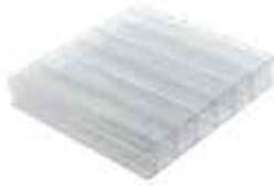
polykarbonát čirý 16mm