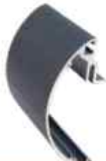
dekorační lišta Softline