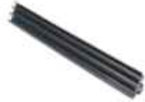
těsnění přítlačné lišty