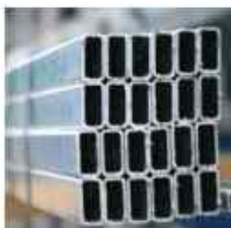
statické vložky okapů XL