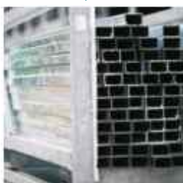
statické vložky okapů L