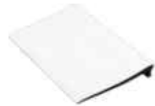
těsnění nástěnného profilu