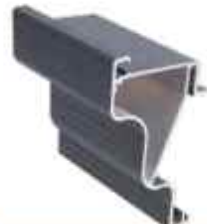
dekorační lišta Wave