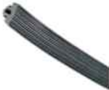
těsnění krokve pro sklo