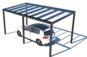
Carport – 1 místo