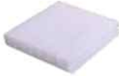
polykarbonát bílý 16mm