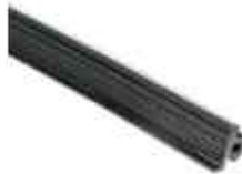
těsnění krokve pro polykarbonát