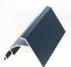
přítlační lišta krajová