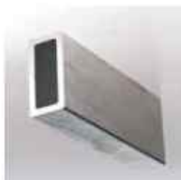
statické vložky okapů L