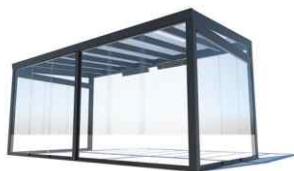
Zastřešení volně stojící s bočními stěnami