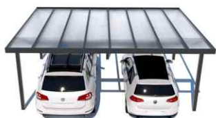
Carport – 2 místa