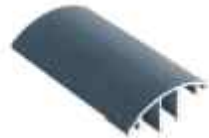
přítlačná lišta středová