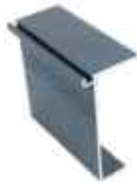
kryt nástěnného profilu